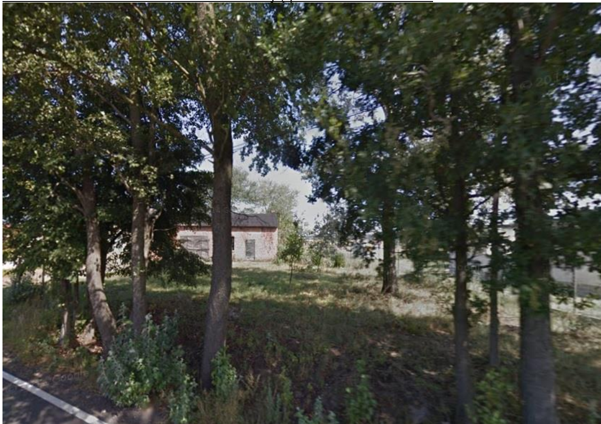
Zieleń na obszarze projektu zmiany planu

Obszar objęty projektem zmiany planu charakteryzuje się występowaniem roślinności łąkowej. Przy granicy z drogą rosną drzewa liściaste a za zabudowaniami istnieją pozostałości sadu.