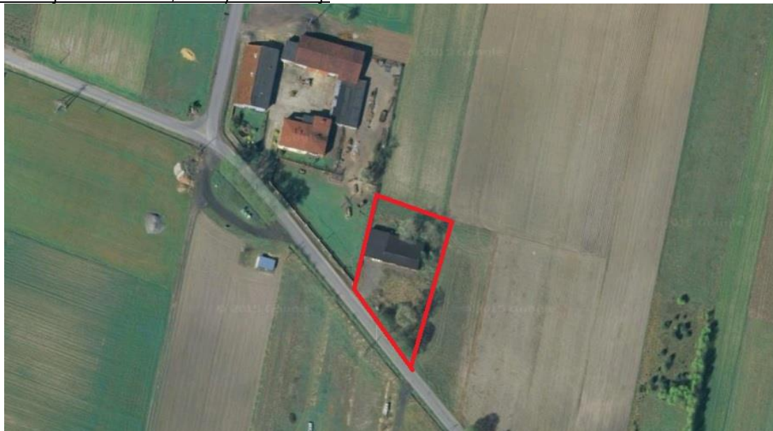
Lokalizacja obszaru objętego zmianą planu

Obszar objęty projektem zmiany miejscowego planu zagospodarowania znajduje się w północnej części gminy, w miejscowości Konin. Teren ma kształt zbliżony czworoboku i jest zlokalizowany przy drodze gminnej nr108254E, klasy lokalnej.